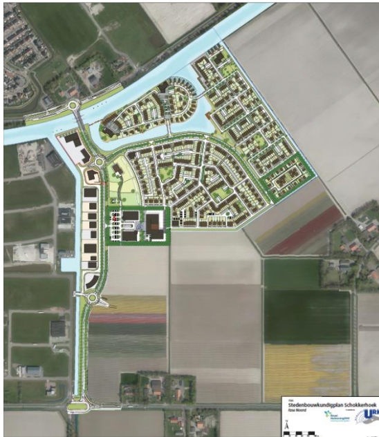
Figuur 2: Zeeheldenwijk fase 1